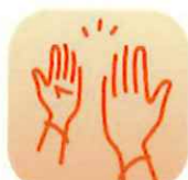
いつでもみまもりアプリ アイコン